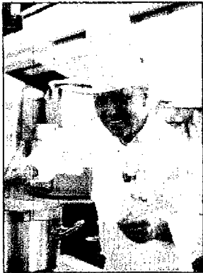
Heinz Beck, il grande chef tedesco ormai naturalizzato romano è uno dei maggiori estimatori dello spaghetti