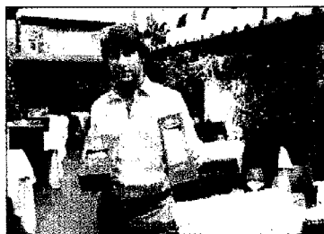
CON IL BRAND DEL LOCALE

Ammalia i palati più esigenti e incanta i vip della Capitale. Il massimo? Fatto nella trafila d'oro