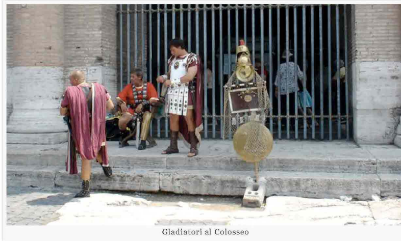
Gladiatori al Colosseo