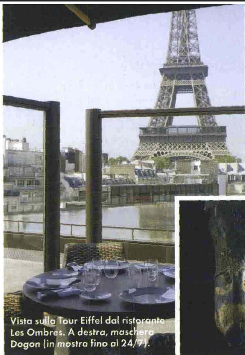
Vista sulla Tour Eiffel dal ristorante Les Ombres. A destra, maschero Dogon (in mostra fino al 24/7).