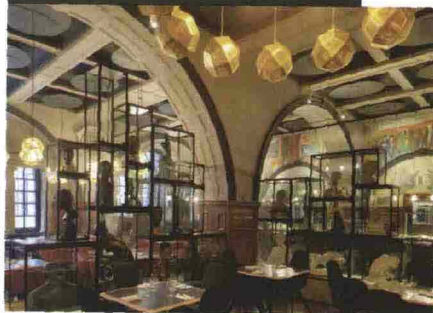
Sotto, The Restaurant at the Royal Academy of Arts.

Sul menù anche... Fino al 15/8, solo il venerdì, la cena permette anche la visita alla tradizionale Summer Exhibition, la più grande mostra open d'arte contemporanea del mondo, quest'anno eccezionalmente a tema libero. The Restaurant at the Royal Academy of Arts, Burlington House, Piccadilly, Londra; www.royalacademy.org.uk .