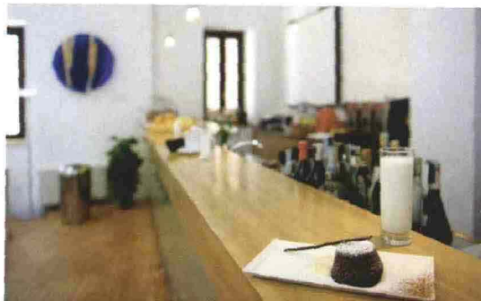
Sopra, il bancone del Gourmart al Gam di Palermo.