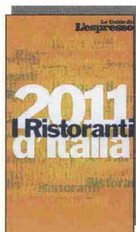
20/20 (X 5)

gastronomiche italiane, L'Espresso, Il Gambero Rosso e la Guida Michelin edizione 2011 ci hanno fornito il materiale per stilare una classifica che attraverso una sintesi delle rispettive valutazioni esprima la media aritmetica attribuita ai ristoranti. Ciò per dare al lettore uno strumento di informazione quanto più possibile aggiornato ed obiettivo. Per comporre questa graduatoria tutti i punteggi sono stati tradotti in centesimi, privilegiando i locali segnalati in tutte e tre le guide, e non quelli con maggiori votazioni ma esclusi da almeno una di esse. La Top Chart riguarda le prime tredici posizioni, all'interno delle quali si possono trovare anche più ristoranti a pari merito.