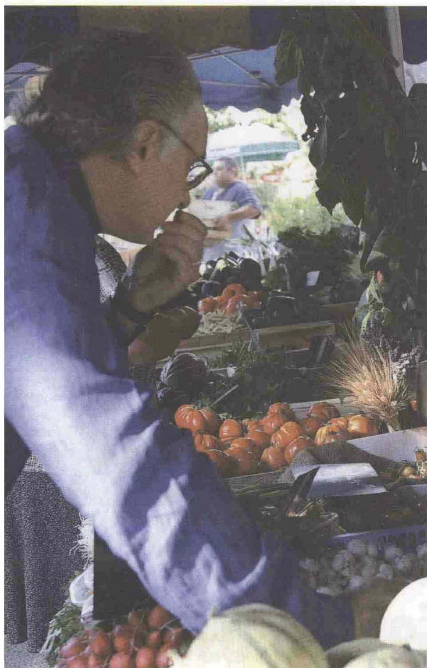
In giro per mercati Alain Ducasse verifica consistenza e profumo delle verdure di stagione in un mercato provenzale.

contadini, macellai, produttori di formaggio sembrava una fissazione. Invece avevano ragione: nel forum gastronomico The Flemish primitives, a Ostenda, le giovani leve di quelle teorie che allora apparivano rivoluzionarie e oggi sono sulla cresta dell'onda si inginocchiano di fronte a quei visionari.