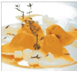
TORTELLI DI CASTRATO, TIMO E PATATE, DAL NUOVO LIBRO DI ANTONELLO COLONNA.

Il 17 gennaio quasi 1.000 cuochi italiani in 70 Paesi hanno cucinato un piatto di pesto. Merito dell'iniziativa del Gruppo Virtuale Cuochi Italiani, che da anni si batte per la tutela e promozione della cucina italiana (itchefs-gvci.com).