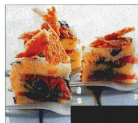
SANDWICH DI PANETTONE E PROSCIUTTO D'ANATRA. A LATO, LA COPERTINA DEL RICETTARIO.

Ma la sua scommessa più grande è forse l'ultima in ordine di tempo: destagionalizzare il panettone, dandogli un nuovo ruolo in cucina. Missione riuscita con le ricette del libro "Mille e un...panettone" studiate dallo stellato