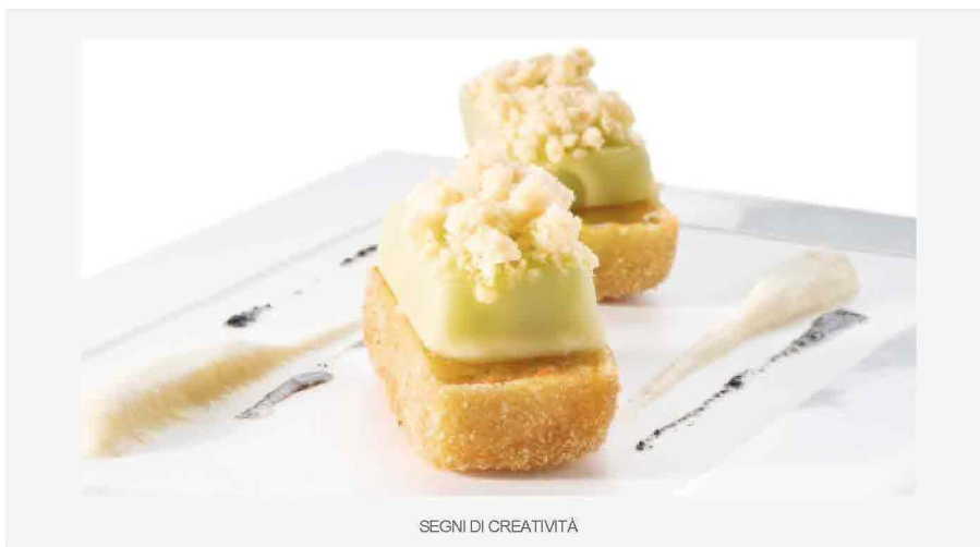
SEGNi DI CREATIVITÀ

INFORMAZIONI SU MANIFESTAZIONE IDENTITÀ GOLOSE MILANO