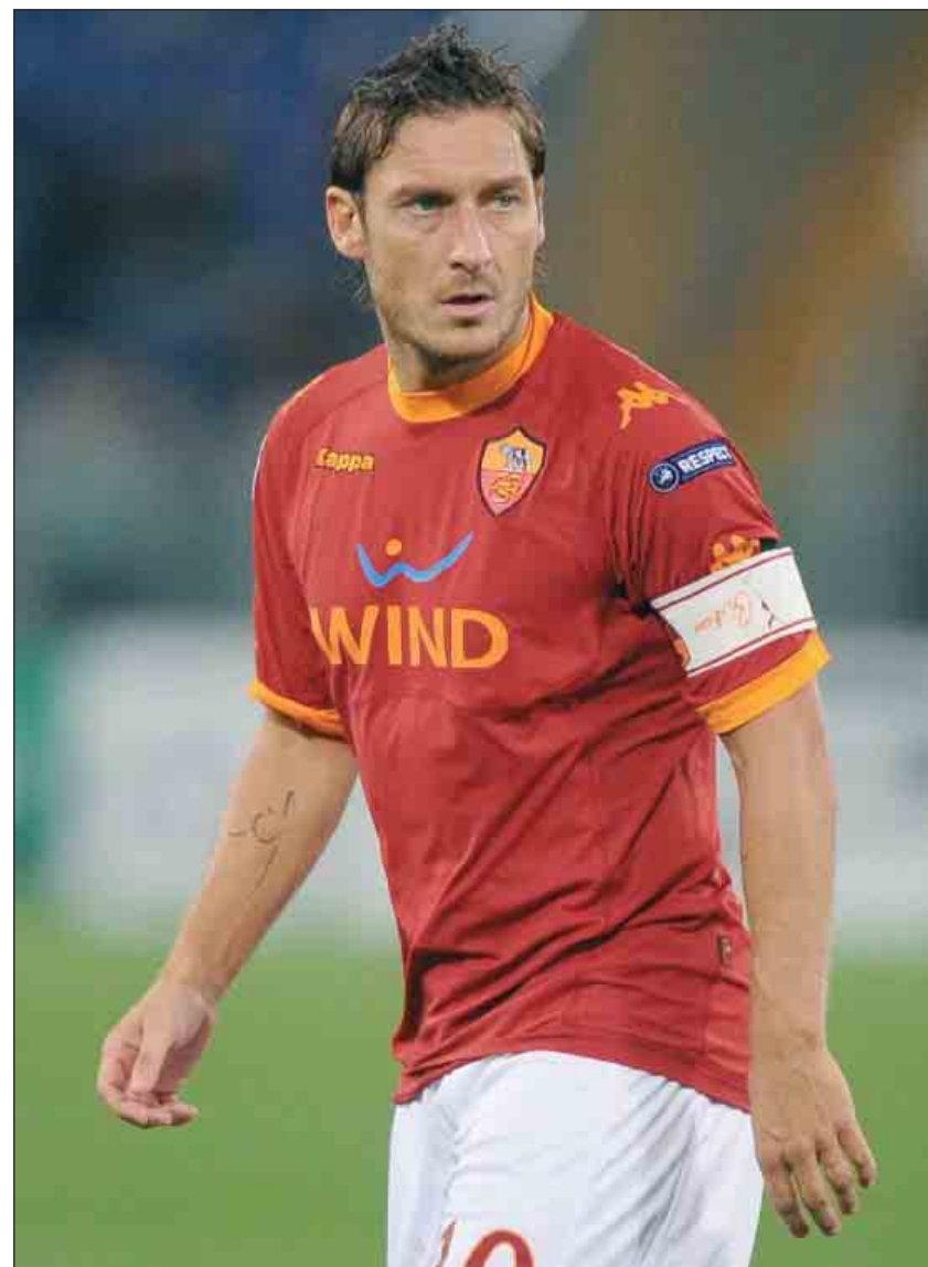
CON LA FASCIA Francesco Totti, capitano della Roma, in cui gioca dal 1992-93, da più di 10 stagioni