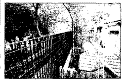
Il centro anziani di Largo Fugliese

Fino a qualche mese fa ci giocavano a carte, gli anziani del quartiere. Ora in quella casetta di legno, sono arrivati i rom, e per il centro di Largo Sergio Fugliese, non c'è più pace.