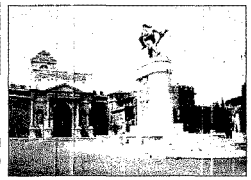
Un'immagine della piazza di Porta Pia

Porta Pia, la polemica sull'omaggio ai papalini finisce in Consiglio