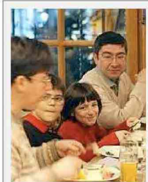
Bambini al brunch

Si moltiplicano le proposte di buffet studiati dagli chef per i più piccoli: da La Mantia a Colonna , menu dedicati