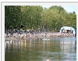
Una manifestazione sportiva sul lago di Martignano

DUE RUOTE DAL LAGO - Ed ecco l'altra idea domenicale, divertente e impegnativa, quasi quanto la prova di arrampicata. Stavolta si fatica di fondo, pedalando per 35 chilometri su strade sterrate e non, sudando e alzandosi sui pedali. Poche salite, ma buone. A fil di lago, quello di Martignano, tra le valli del Sorbo. L'appuntamento è alle 9 in punto, di domenica, al largo del Castagneto, sulla via Formellese, dieci chilometri a nord di Formello.