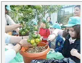
Bambini al museo Explora

OFFICINA EXPLORA - I piccoli pare ci abbiano preso gusto, più responsabili ed esigenti, anche a tavola. Un progetto come l'Officina in cucina, sembra fatto apposta per loro. Via dal brunch, ora siamo da Explora, il museo dei bambini di Roma, in via Flaminia, dove è stato inaugurato il nuovo spazio laboratorio di educazione alimentare, in collaborazione con Colussi. Sì, quelli del biscotto Gran turchese, preparato, cotto e servito proprio qui, nel laboratorio.