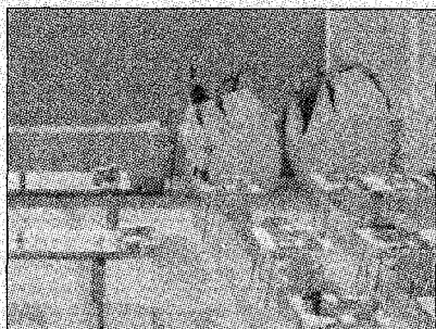
LUCI E SAPORI

una cucina firmata in cui la romanità si sposa con la modernità, la tradizione con l'internazionalità, in un matrimonio di eterno appagamento dei sensi». Il tutto, ovviamente, firmato Antonello Colonna.