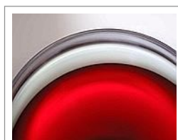
Un calice di vino fotografato da Cerisola

Sorprendenti le foto dei piatti di Colonna. Vasta la varietà di strutture e di colori del cibo: quello prodotto dalla natura e quello reinventato dallo chef, sacerdote del gusto. Queste foto colgono non solo la bellezza apparente, ma anche la cultura e l'amore del professionista dei fornelli per la cura dei dettagli. Qualche critico si spinge a parlare di seduzione della cucina nelle foto di Cerisola, sotto forma di «erotismo vegetale». L'autore cattura per sua scelta particolari che ad altri sfuggono: della forma perfetta dell'uovo vuole solo una sensuale sezione di curva, del design inarrivabile dell'arancio coglie un gioco d'ombre, dell'umile broccolo esalta la spirale di sontuoso tempio orientale, dello spinoso carciofo ci rivela l'anima di macchina da guerra. Ma poi riesce pure a dissolvere un calice di vino in un rosso manierista, accolto e raccolto in una forma di grigi splendenti e superbi, con un purpureo inquilino. All'Open si consuma così, in questi giorni, un pasto culturale che Colonna e Cerisola servono con un percorso sensoriale davvero magico.