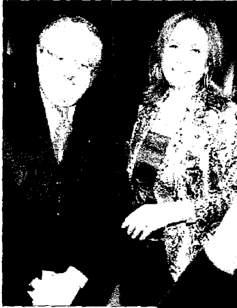
Andrea Margelletti con Rosanna Lambertucci.