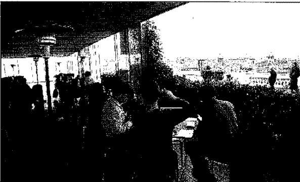
A sinistra, la terrazza del Caffè Capitolino, al secondo piano dei Musei Capitolini e, a destra, l'ingresso del Bras Café a Palazzo Braschi