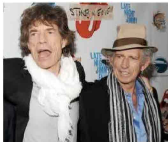
MICK JAGGER E KEITH RICHARDS