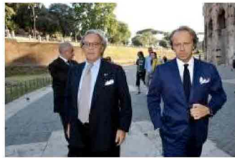
DIEGO DELLA VALLE E FRATELLO ANDREA

7- Dallo chef Antonello Colonna si cucina il Terzo Pollo: martedì 22 novembre Francesco Rutelli presenta il suo nuovo libro "Non è vero". Sul palco ci saranno anche Fini e Casini, moderati da Mario Orfeo. Dalle 18, Palazzo delle Esposizioni, via Milano 9a, Roma.