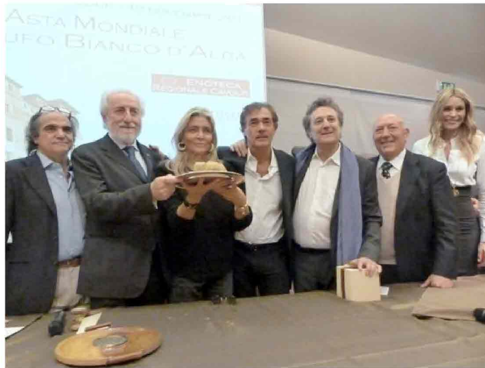
Immagini dalla XIII Asta del Tartufo.

98 mila euro per il lotto più prezioso conteso tra Grinzane e Hong Kong. Altri 16 mila e 500 euro raccolti per Borghetto in Liguria