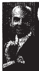
Enzo Miccio, conduttore tv esperto di stile

proposte classiche è assolutamente praticabile: dalla panzanella alla mozzarella in carrozza».