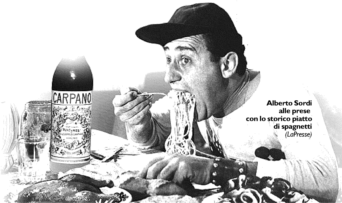
Alberto Sordi alle prese con lo storico piatto di spagnetti