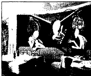
Il ristorante l'Antica Pesa